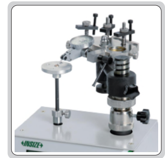
检验杠杆表的测力