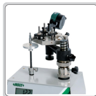
检验内径量表的测力