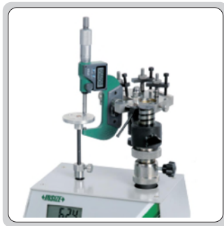
检验千分尺的测力