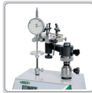
检验百分表的测力