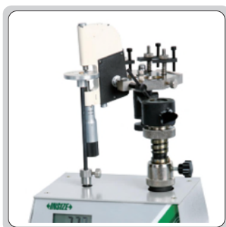
检验杠杆千分尺的测力